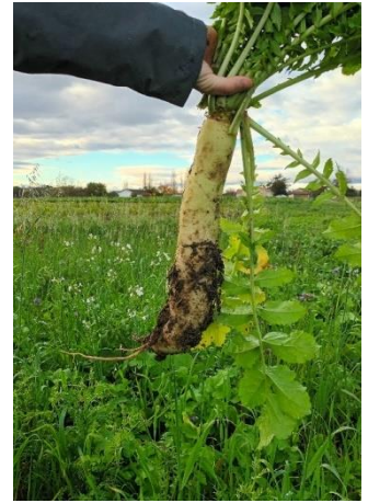
Pivot « coudé » de radis chinois à 15 cm de profondeur

Compléments : observation d'une zone de tassement à 15 cm de profondeur