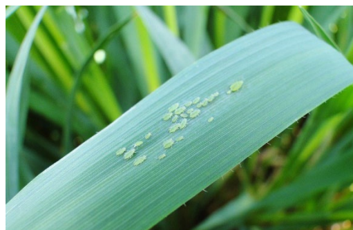
Pucerons verts : sources arvalis

Les résultats d'essais réalisés par ARVALIS entre 2015 et 2021 dans des conditions de semis précoces et de surveillance assidue des pucerons mettent en évidence une relative souplesse dans la date d'application de l'insecticide vis-à-vis de cette cible : un décalage de l'application 14 jours après la date d'atteinte du seuil ne conduit pas à des pertes de rendement supplémentaires, comparé à un traitement au seuil. Cela a même été bénéfique dans 3 essais sur 16.