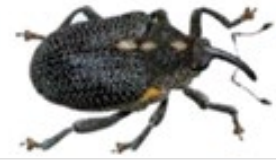
Charançon du bourgeon terminal (Terres Inovia)

Le risque agronomique est faible sur des gros colzas, qui sont encore poussant (pas de rougissement des feuilles).